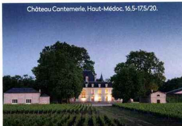
Château Cantemerle, Haut-Médoc, 16,5-17,5/20.