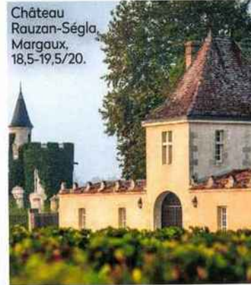
Château Rauzan-Ségla, Margaux, 18,5-19,5/20.