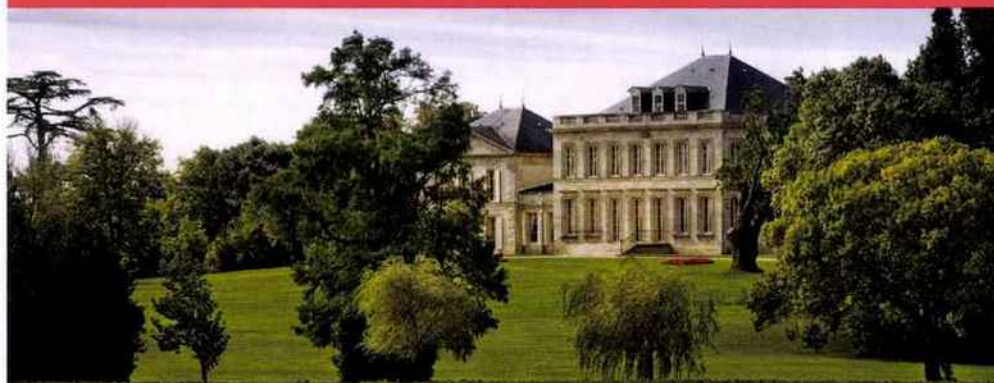
Château Phélan Ségur, il est à nos yeux exceptionnel.