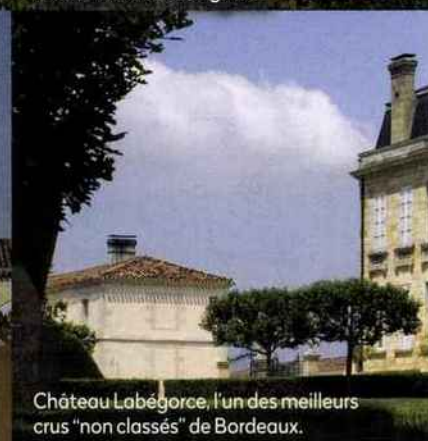
Château Labégorce, l'un des meilleurs crus "non classés" de Bordeaux.