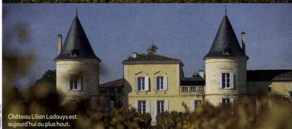
Château Lilian Ladouys est aujourd'hui au plus haut.