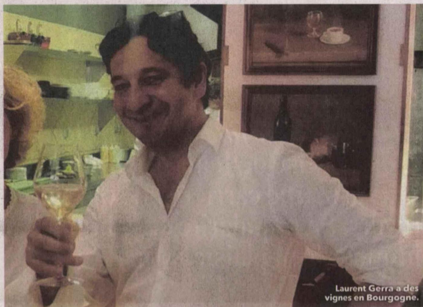
Laurent Gerra a des vignes en Bourgogne.

des artistes. Le sud-ouest attire de la même façon beaucoup de personnalités publiques. L'ancien footballeur Bixente Lizarazu a fait l'acquisition du Château de Plaisance- Grand Cru, à Saint-Emilion. Christophe Lambert est à côté, dans le Médoc, au Château Tour Seran . Depardieu est également présent dans cette région avec le Château Gadet dans le Médoc et le Château Lussac à Saint-Emilion. Francis Cabrel a choisi de rester chez lui, à Astaffort,